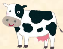
搾乳体験とお菓子作り!