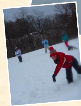
もちろん、雪遊びも!