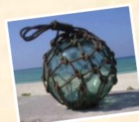
漁師さんから学ぶ! 浮き玉ロープワーク!