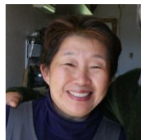
まりこさん 栄養満点のご飯と笑顔でみんなにパワーをくれる。食事担当。