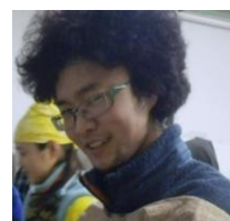
たつみ 天然パーマのもじゃもじゃ頭がトレードマーク☆お魚好きの雑学ボーイ。