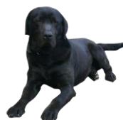
グラツチェ 元気いっぱいのアイドル犬！好きなことは散歩☆