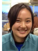
ちこ もりもりとご飯を食べて笑い声も元気いっぱい、黄色大好きガール。