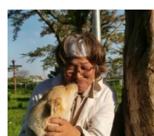
ホッシー&ペロ 色々な場面で登場するお助けマン&おなかを見せる姿が愛くるしい忠犬ペロ。