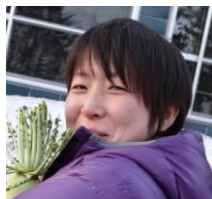
ふみぞう ぶな森チーフディレクター。野菜とかぼちゃを愛する畑ガール。