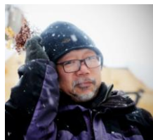
たかぎい (別名JETT) 子どもたちと全開で遊ぶ自然学校の校長先生