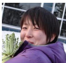
ふみ ぞう ぶな森チーフディレクター。野菜とかぼちゃを愛する畑ガール。