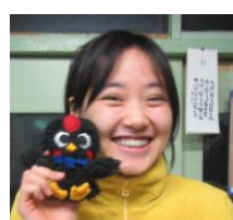
ちこ もりもりとご飯を食べて笑い声も元気いっぱい、黄色大好きガール。