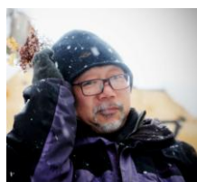
たかぎ (別名JETT) 子どもたちと全開で遊ぶ自然学校の校長先生